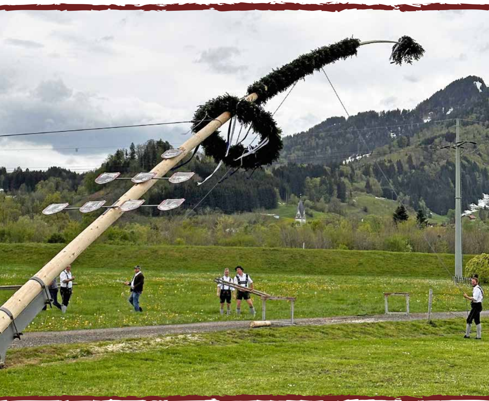
Maibaumaufstellen im Ortsteil Häuser.