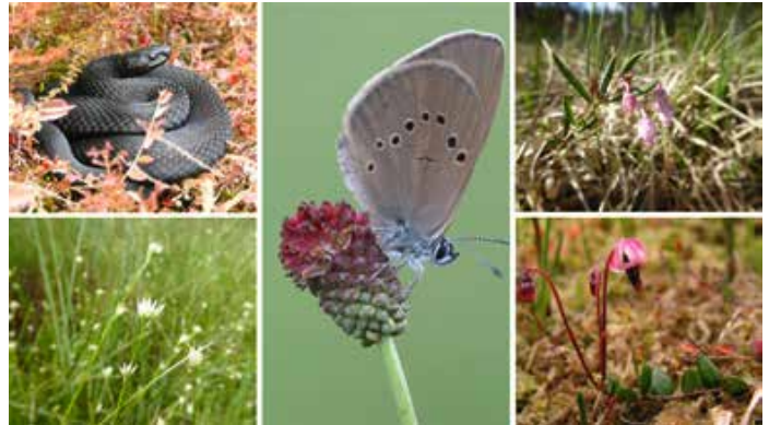
Die „Höllentotter“, die Moorausführung der Kreuzotter (links oben), das Weiße Schnabelried (links unten), der Dunkle Wiesenknopf-Ameisenbläuling (Mitte), die Rosmarinheide (rechts oben) sowie die Moosbeere (blühend- rechts unten) sind im Goymoos bzw. Agathazeller Moos zu finden.