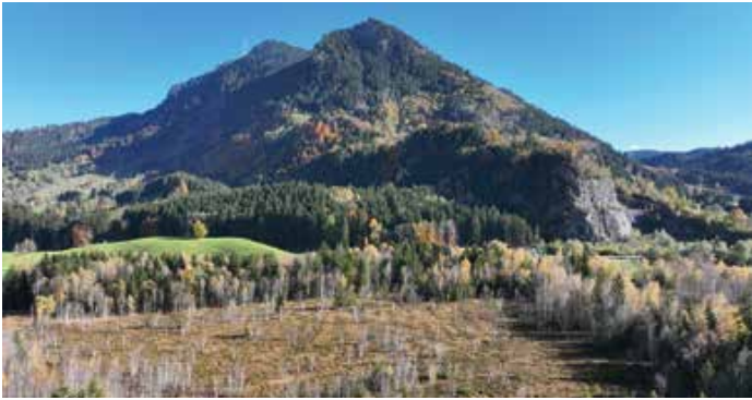
Luftaufnahme des „Agathazeller Moos“.

Der Landschaftspflegeverband Oberallgäu-Kempten (LPV OA-KE) startete im September letzten Jahres das neue Großprojekt „Oberallgäuer Moorverbund“. Im Rahmen des vierjährigen Projektes, welches mit einem Projektvolumen von 773.000 Euro zu 90 % vom Freistaat Bayern gefördert ist, werden ausgewählte Allgäuer Moorkulissen renaturiert bzw. wiedervernässt.