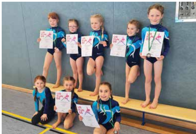
Jahrgang 2017 und 2018