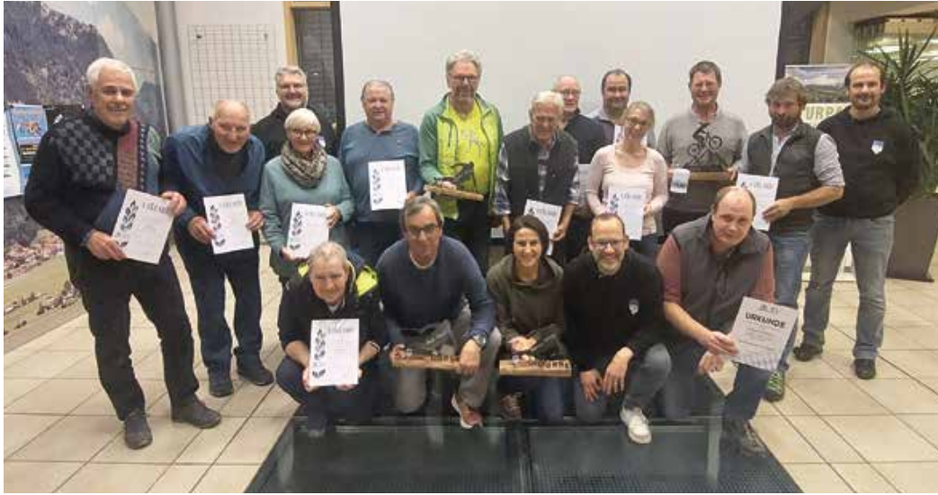
Ehrungen bei der Jahreshauptversammlung des Ski-Club Burgberg.

Am Mittwoch, den 19. November 2025, war es wieder soweit. Alle Jahre wieder, lud der Ski-Club Burgberg seine Mitglieder zur ordentlichen Mitgliederversammlung in das Markthaus Burgberg ein.